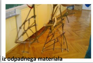
Ekoizdelki iz odpadnega materiala