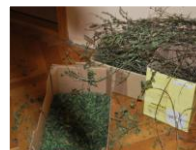
zelišča za čaj