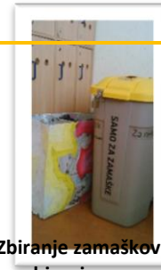
Zbiranje zamaškov Ločeno zbiranje odpadkov in odpadnih baterij