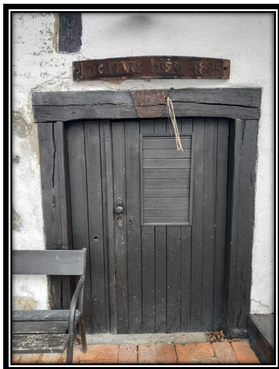
Jakljeva hiša, zgrajena 1885 leta.