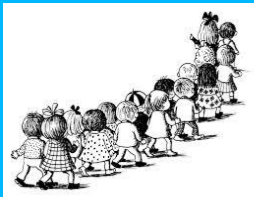
Ilustracija priznane ilustratorke Jelke Reichman.

V prilogi dopisa vam podajamo še kratek povzetek dobrodošlih informacij.